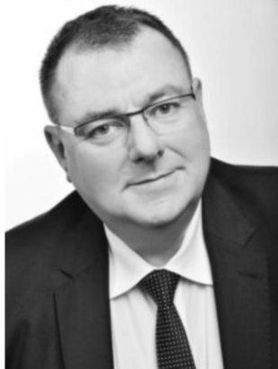
Ingo Bodtke MdB

Der Beirat der Allianz der Verbände e.V.