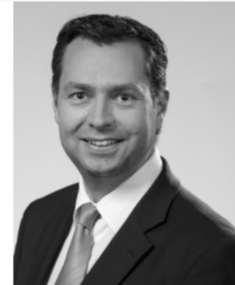
Stefan Mayer MdB